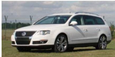
Drive-by-wire-Fahrzeug zur Erprobung aktiver Fahrerassistenz

Mit einem neuen Versuchsfahrzeug als flexiblem Versuchsträger macht das Institut einen weiteren Schritt in Richtung drive-by-wire. Die Lenksäule wurde durch ein eigenes System ersetzt, das die Lenkkräfte an die Reifen über Software (also „by-wire“) überträgt. Dadurch können neue Übertragungskennlinien eingesetzt werden, die das Fahren komfortabler und sicherer machen. Das Fahrzeug wird mit modernen Bussystemen wie z.B. Flexray sowie mit einer redundanten Steuereinheit aus der Luftfahrt ausgestattet. Derzeit werden Regler und Algorithmen für das Lenksystem entwickelt.