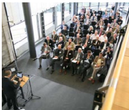
Tagung „Verkehrsmanagement von morgen – Hoheitliche Aufgaben im Spannungsfeld zu kommerziellen Lösungen“ im Berliner Technikmuseum

Die Tagung „Verkehrsmanagement von morgen – Hoheitliche Aufgaben im Spannungsfeld zu kommerziellen Lösungen“ brachte am 1. Oktober 2009 rund 70 Experten im Berliner Technikmuseum zusammen. Im Fokus der gemeinsamen Veranstaltung des DLR-Instituts für Verkehrssystemtechnik und dem Forschungs- und Anwendungsverbund Verkehrssystemtechnik (FAV) der TSB Innovationsagentur Berlin standen die Herausforderungen im Zusammenspiel eines übergreifenden Verkehrsmanagements mit individuellen Systemen und kommerziellen Entwicklungen. Forschungsansätze sowie die verbindenden und hemmenden Elemente der verschiedenen Konzepte wurden beispielhaft vorgestellt