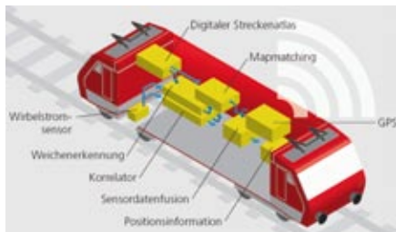
Systemarchitektur von DemoOrt

Der Aufbau des drive-by-wire-Fahrzeugs erfolgt im Kontext des EU-Projektes HAVEit. Darin werden Copilot-Prototypen aufgebaut, die das Fahren sicherer machen. Zentrale Herausforderungen sind dabei die Erkennung der Fahrsituation, das Berechnen der Ausweichstrategie und das Ansteuern der Fahrzeugaktoren. Das drive-by-wire-System ermöglicht Eingriffe, die mit einer konventionellen Lenkung nicht möglich wären. So kann am Lenkrad hochdynamisch jede beliebige Kraft oder Position eingestellt werden, unabhängig von der aktuellen Stellung der Vorderräder. Dies schafft Freiraum für die Erforschung und Entwicklung neuer Sicherheitsfunktionen.