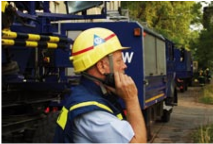
DELPHI unterstützt Einsatzkräfte bei der Entscheidungsfindung für das Routing der Einsatzfahrzeuge und beim Verkehrsmanagement im Ereignisfall