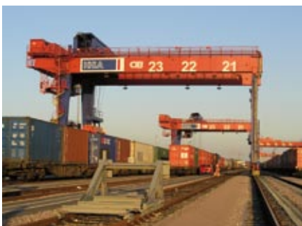
Eisenbahn-Hinterlandhubs dienen der Beladung voll ausgelasteter Züge zur Entschärfung von Streckenengpässen