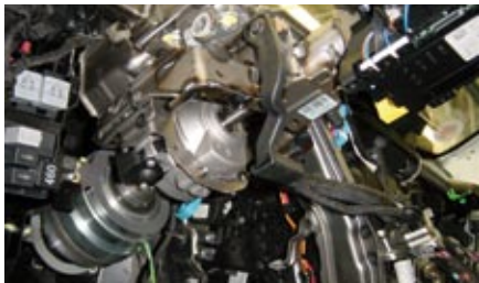
Die konventionelle Lenksäule wurde durch eine vom DLR entwickelte Steer-by-wire-Einheit mit Lenkmomentsteller und mechanischer Entkopplung ersetzt